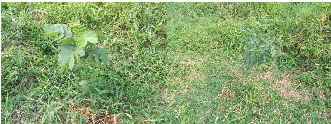
Figura 4: Coroamento de mudas na Fazenda Cachoeira.