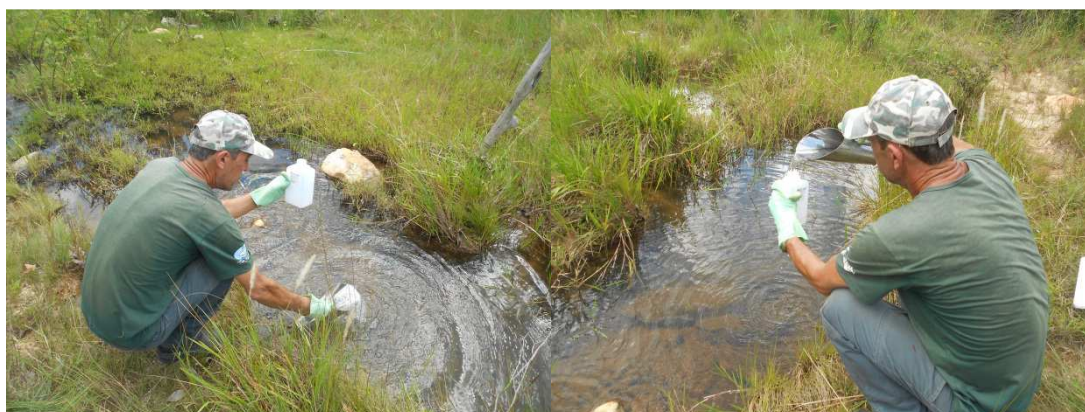
Figura 11: Coleta de amostras de água no Córrego Furado para análise.