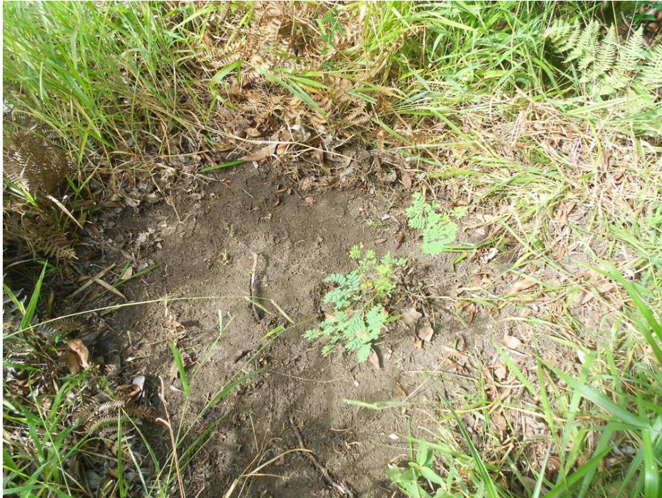
Figura 5: Coroamento de mudas na propriedade do Sr. Antônio.