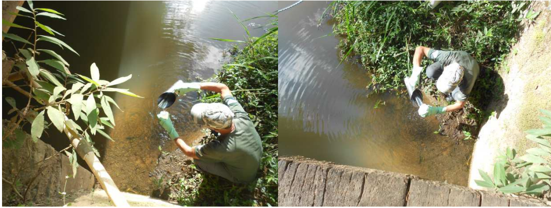
Figura 15: Coleta de amostras de água no Ribeirão Rio Bonito para análise.