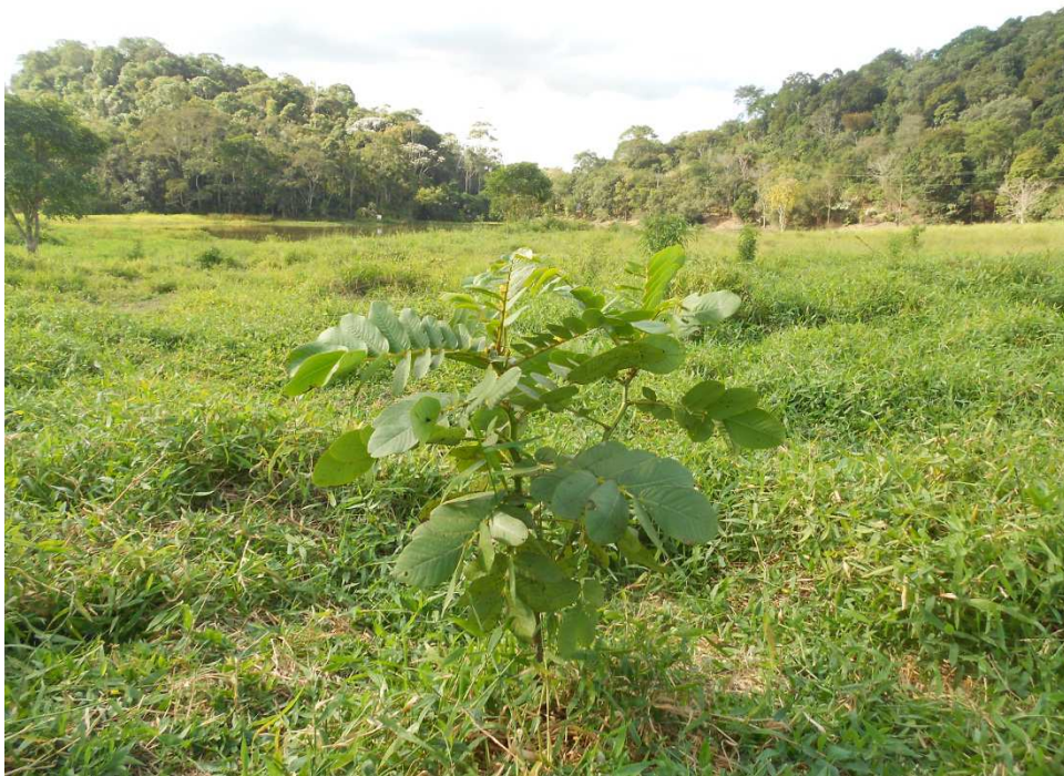
Figura 2: Coroamento de mudas na Fazenda Cachoeira.