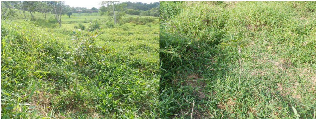
Figura 3: Coroamento de mudas na Fazenda Cachoeira.