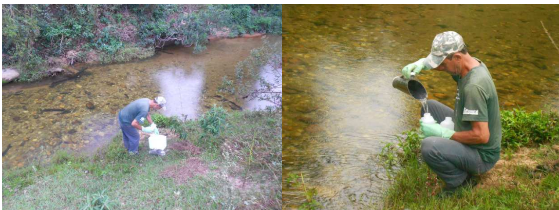
Figura 17: Coleta de amostras de água no Rio Preto para análise.