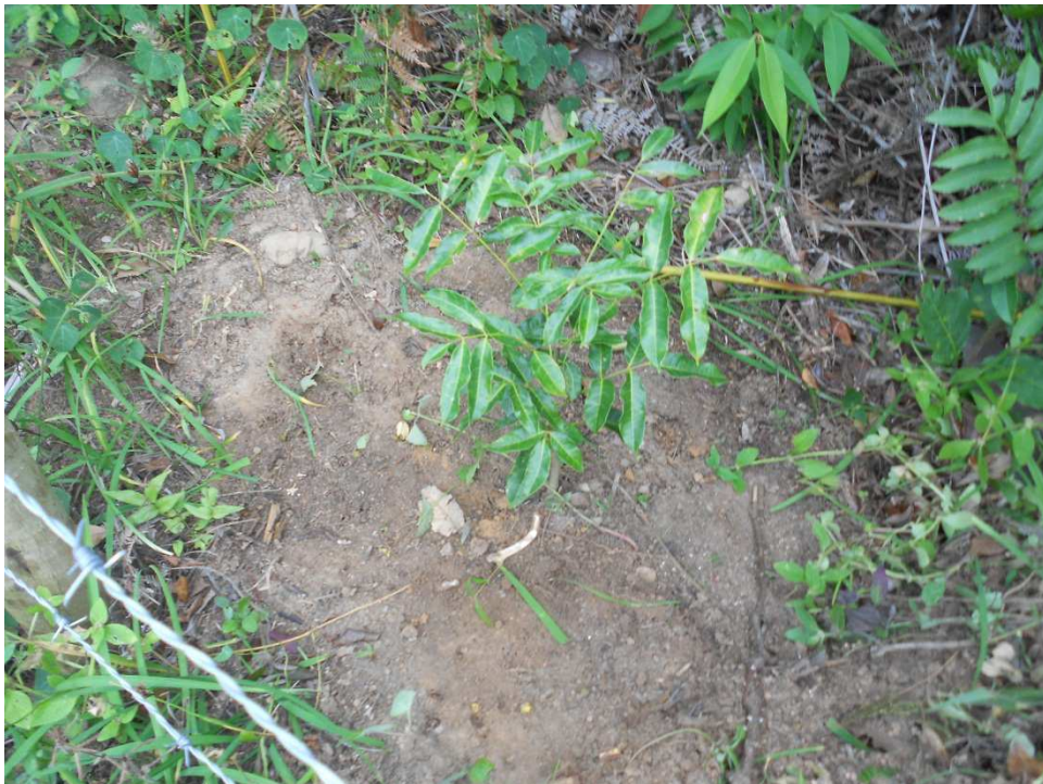
Figura 6: Coroamento de mudas na propriedade do Sr. Rafael.