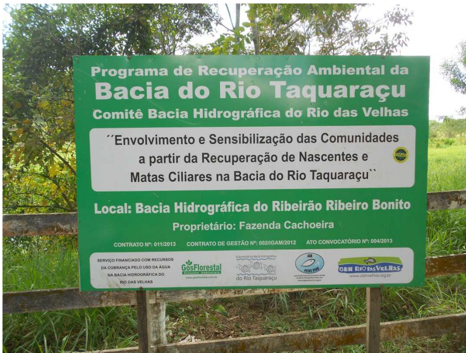
Figura 13: Bacia do Ribeirão Rio Bonito.