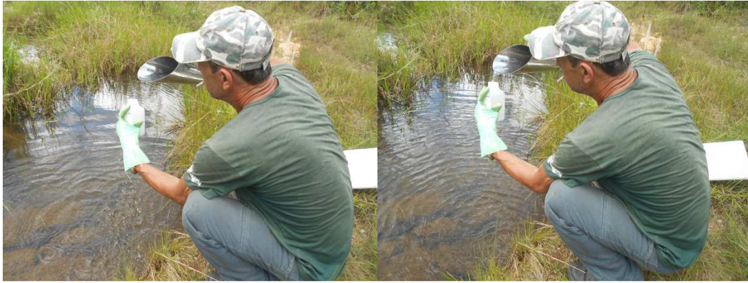
Figura 12: Coleta de amostras de água no Córrego Furado para análise.