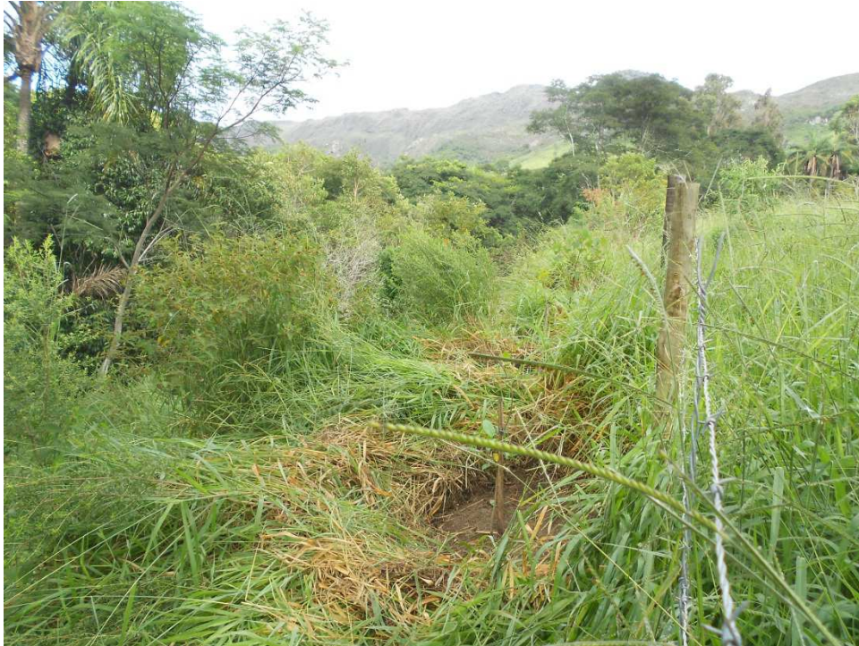
Figura 7: Coroamento de mudas na propriedade do Sr. Sinval.