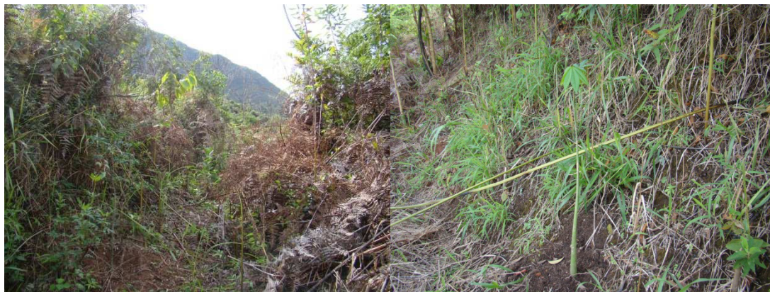
Figura 9: Coroamento de mudas na propriedade do Sr. Luiz Roque.