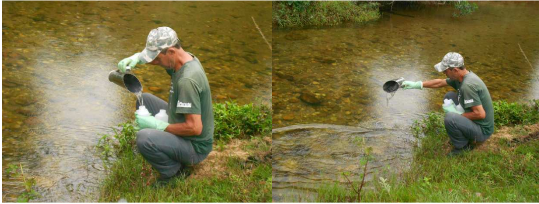
Figura 18: Coleta de amostras de água no Rio Preto para análise.