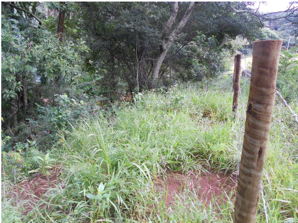
Figura 8: Coroamento de mudas na propriedade do Sr. Afonso.