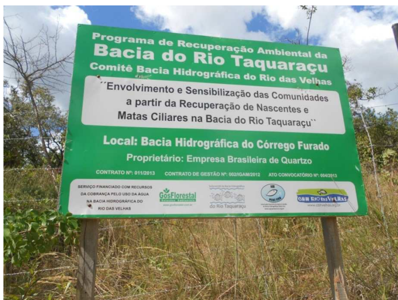
Figura 10: Bacia do Córrego Furado.

As amostras coletadas são encaminhadas para análise no laboratório da Bioagri em Belo Horizonte.