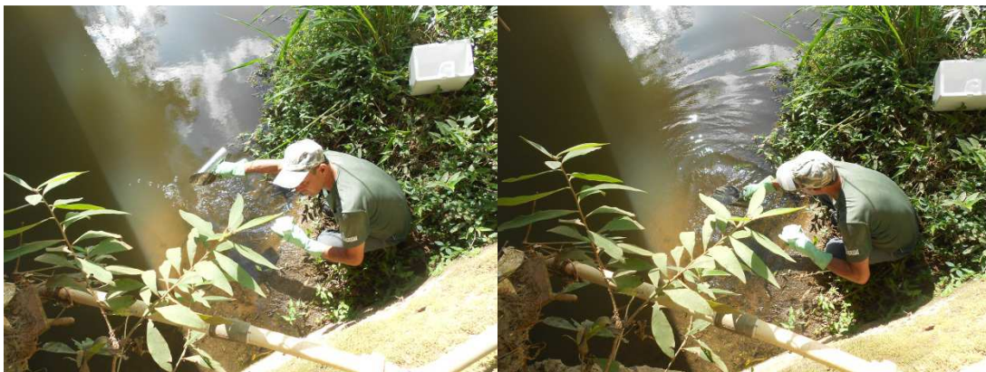
Figura 14: Coleta de amostras de água no Ribeirão Ribeiro Bonito para análise.