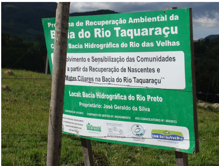
Figura 16: Bacia Hidrográfica do Rio Preto.